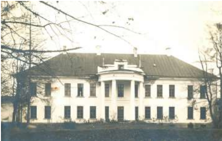
Joonis 5. Kernu mõisa härrastemaja