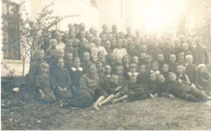
Joonis 7. Kernu õpilased 1925 a. kevadel.