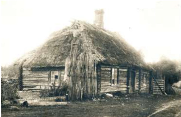
Joonis 3. Esimene koolimaja