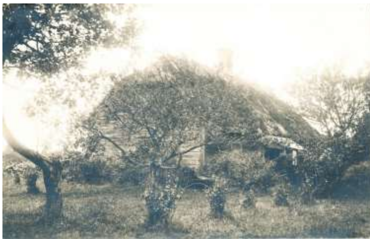
Joonis 4. Kernu teine koolimaja (Kernu kooli arhiiv)

Koolikohustus oli sunduslik kõigile 10 aastaseks saanud lastele. Koolikohustus kestis 3 aastat, õppimine toimus eesti keeles. Laupäeviti käisid koolis need inimesed, kellel kolm talve käidud, enne õpitud aineid kordamas. Suvel käisid kordajad kui ka talvel kooliskäijad kord kuus koolis. Selline kordamine kestis kuni leeri ajani (16-17 aastaseni).